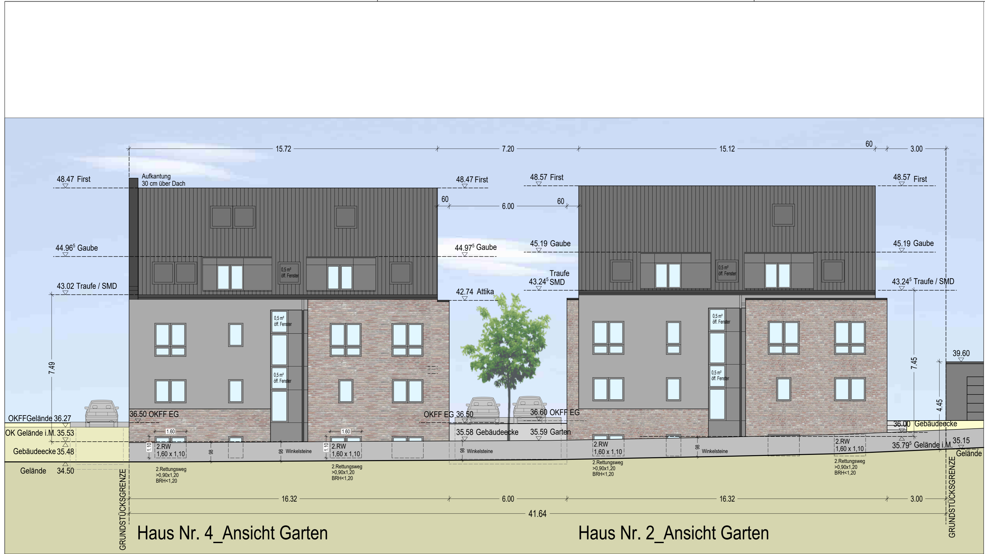
Haus Nr. 4_Ansicht Garten