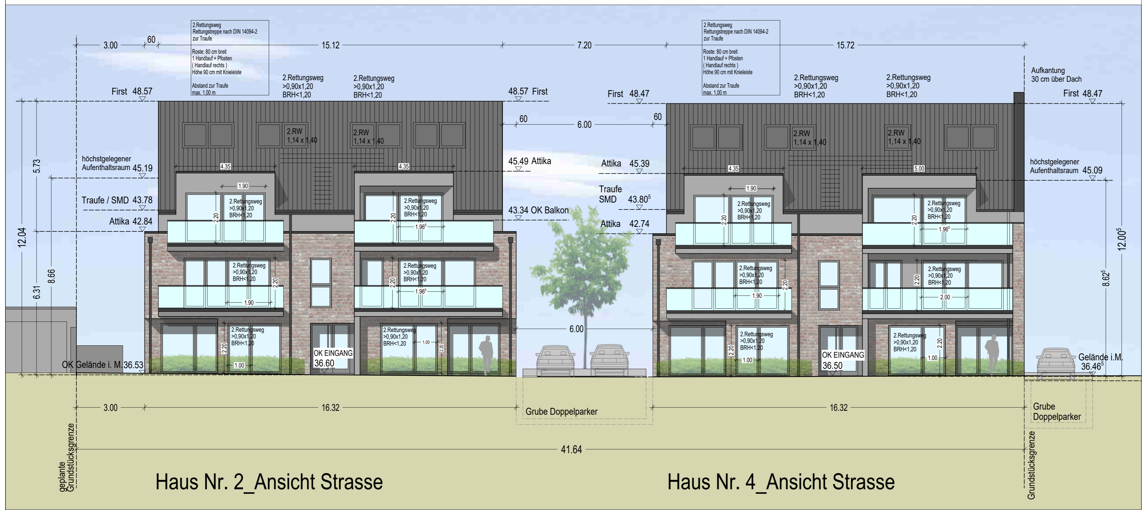
Haus Nr. 2_Ansicht Strasse