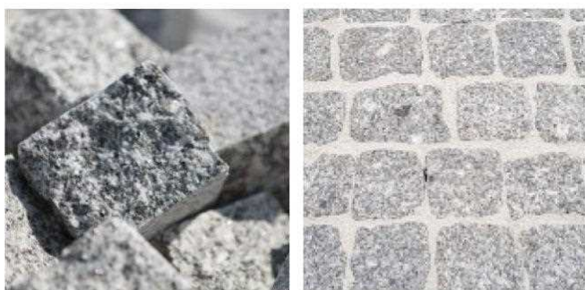
Kleinsteinpflaster Herschenberger Granit