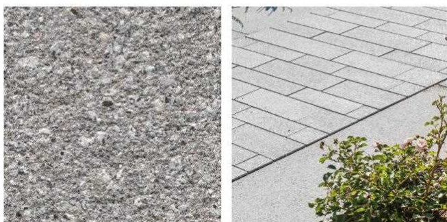
Betonsteinpflaster in Grau-Granit