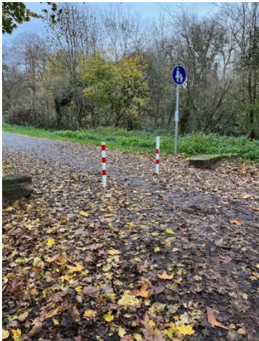
Foto 3: Fußweg von Haus-Endt-Straße Richtung Schlosspark (in unmittelbarer Nähe zur Seniorenresidenz)