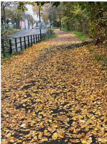
Foto 4: Fuß- und Radweg Hildener Straße Richtung Hilden, nach der Unterführung unter der Münchener Straße