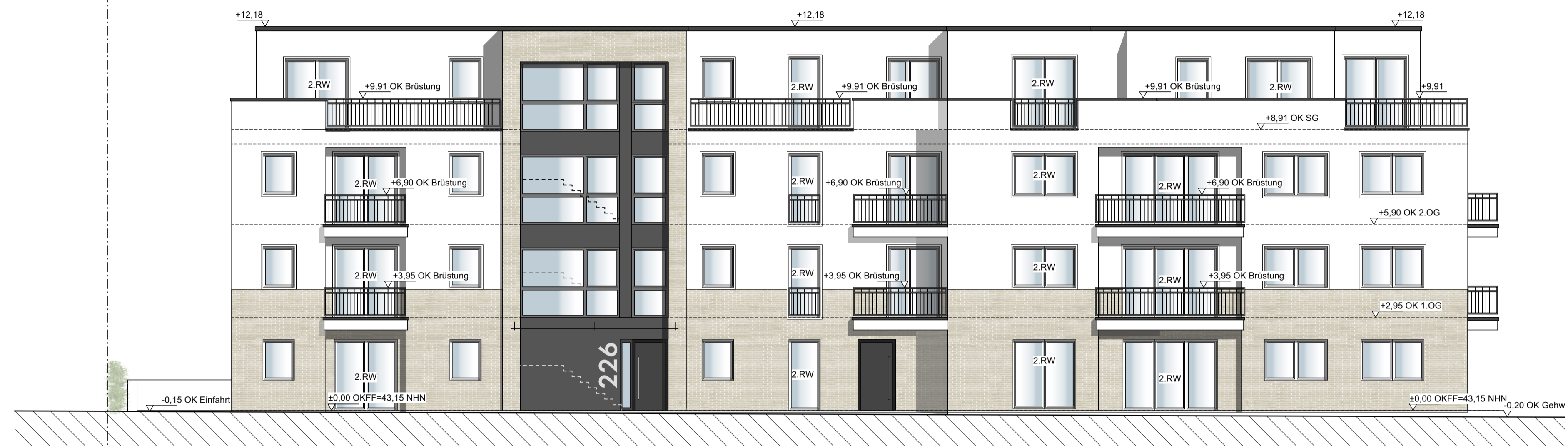
Ansicht Vennhauser Allee