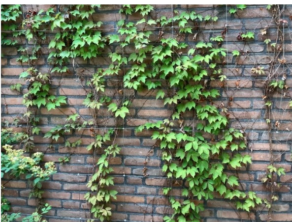
Grünfassade an der Gemeinschaftsgrundschule Bingener Weg, Bingener Weg 10

Grundsätzlich wird im Zuge einer Neubaurichtung, gemäß Standards, die Umsetzbarkeit einer teil- oder vollflächig begrünten