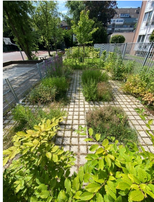
Stoffeler Straße 11

Gerade beim thermisch belasteten Bereich der Schulhöfe können Entsiegelungen die mikroklimatische Situation verbessern. Es werden resiliente Strukturen geschaffen und Folgekosten durch Klimaschäden vermieden.