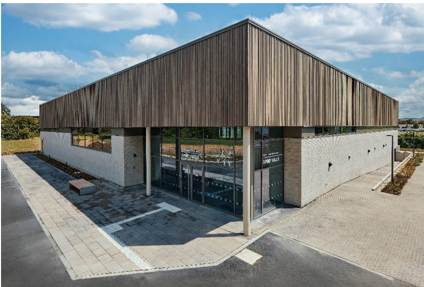
Sporthalle Brucknerstr. 19

Drei weitere Neubauprojekte werden aktuell von Amt 40 nach dem Bewertungssystem Nachhaltiges Bauen (BNB) des Bundes in Silber errichtet und zertifiziert: