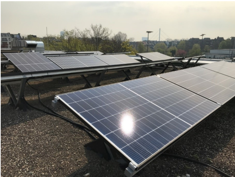
PV-Anlage auf der Carl-Benz-Realschule, Lewitstraße 2, Baujahr 2021, Leistung: 37,63 kWp

abgeschlossen, sodass für diese bereits die darauffolgenden Ausbausritte in den Bereich der Planung und Ausführung gebracht wurden.