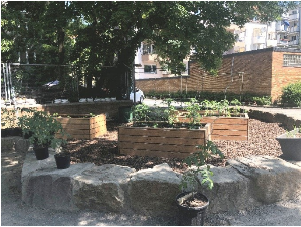
Sonnenstraße 10

Ähnlich der Errichtung von Gründächern sind Entsiegelungsmaßnahmen ein wirksames Mittel gegen die negativen Effekte der Klimaveränderung. Temperaturzunahme und Hitze, Starkniederschläge sowie Niederschlagsverschiebungen und Trockenheit betreffen die gesamte Gesellschaft und Umwelt. Entsiegelte Bereiche übernehmen die Bindung von Staub und die Kühlung der Wohn-, Aufenthalts- und Arbeitsräume sowie der Umgebungsluft durch Verdunstung. Darüber hinaus übernehmen sie die Zwischenspeicherung von Niederschlagswasser, welches sonst aufgestaut in die Kanalisation abfließt und bei urbanen Sturzfluten zum Überlaufen und Überschwemmen von Schulhöfen führt. Außerdem kann das Wasser nicht aufgefangen und genutzt werden. Mit Versickerungsanlagen und Baumrigolen als Regenwasserspeichersystem können bspw. Bäume in Trockenphasen ausreichend mit Wasser versorgt werden.