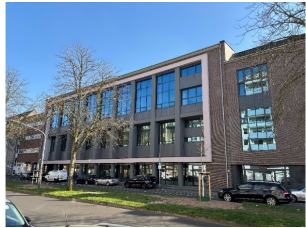
Leibniz-Montessori-Gymnasium, Scharnhorststr. 8 Sanierung Fassade Aula/Turnhalle & Bau eines Aufzuges

Weitere Fassadensanierungen an städtischen Schulgebäuden, die auch energetisch wirksam sind, werden anlassbezogen geplant.