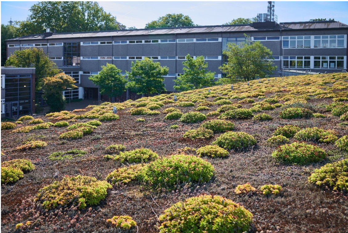
Extensive Dachbegrünung Marie-Curie-Gymnasium Gräulinger Str. 15