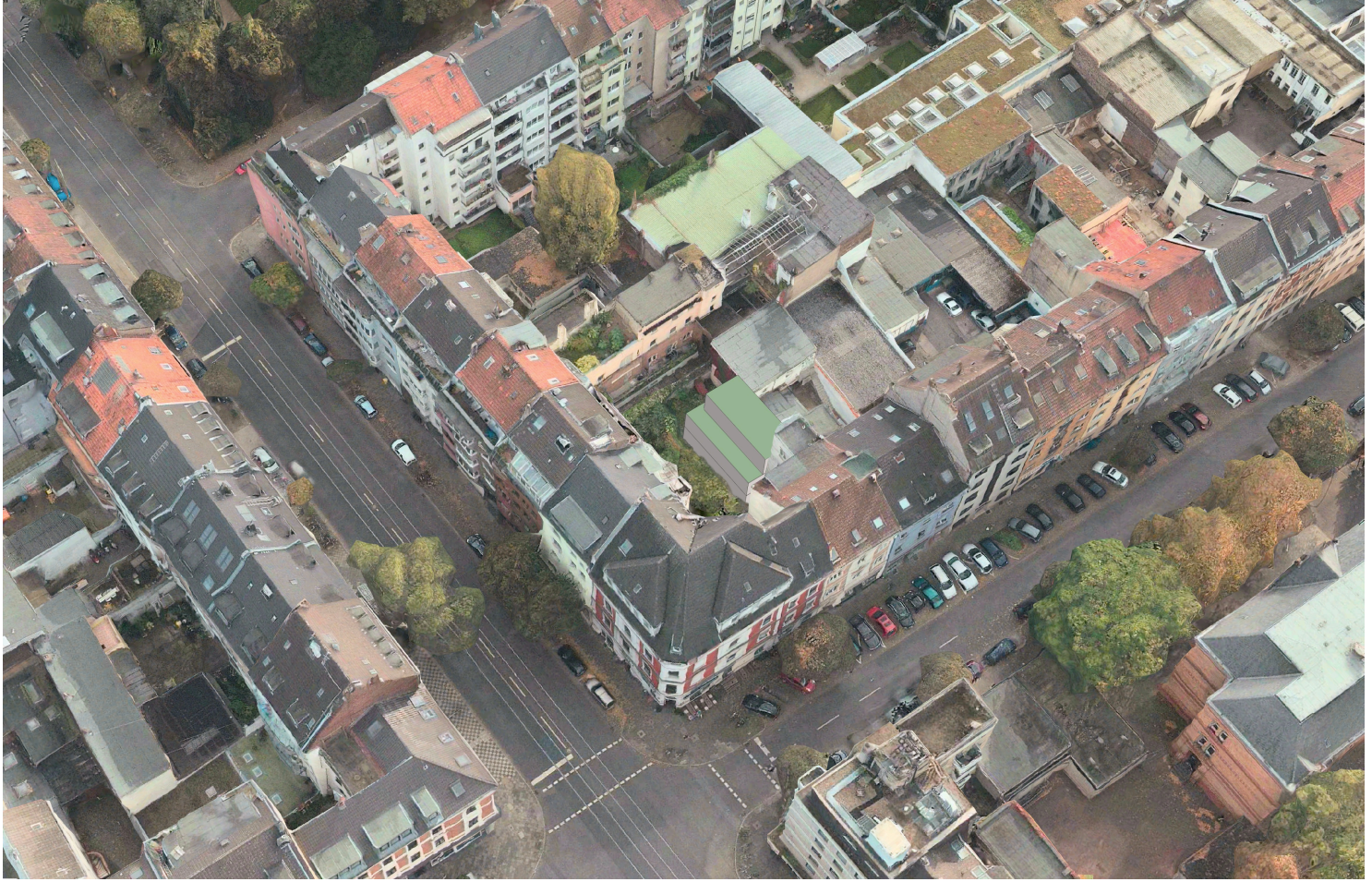
Einfügung Kubatur in Luftbild