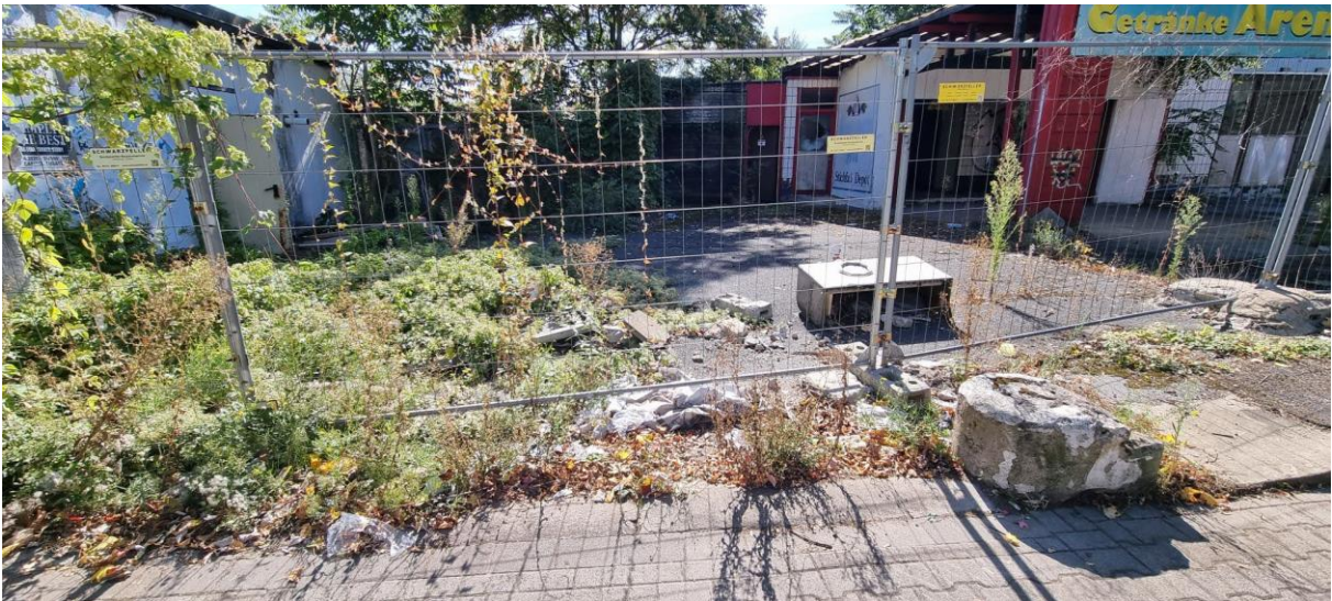
gez. Christian Rütz