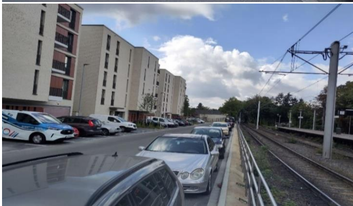
Alte Landstraße entlang der Hausnummern 239, 241, 243