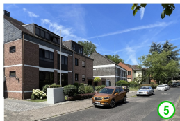
Stargarder Straße 5-9