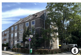
Stargarder Straße 42