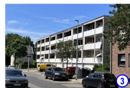
Tönisstraße 42/44 - Graudenz Str. 3