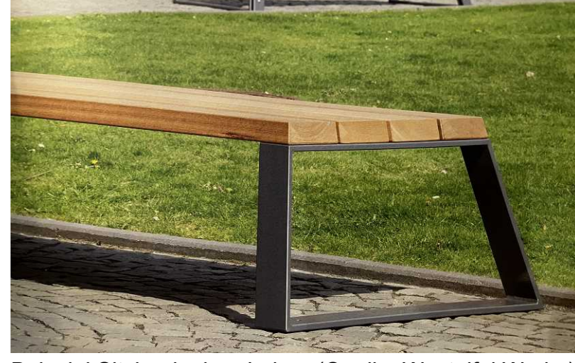
Beispiel Sitzbank ohne Lehne