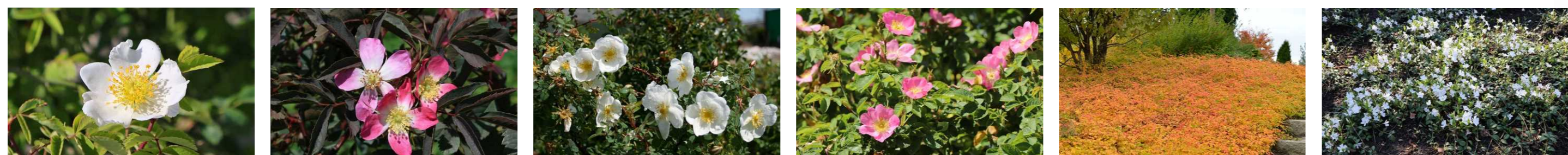
Beispiele Wildrosen