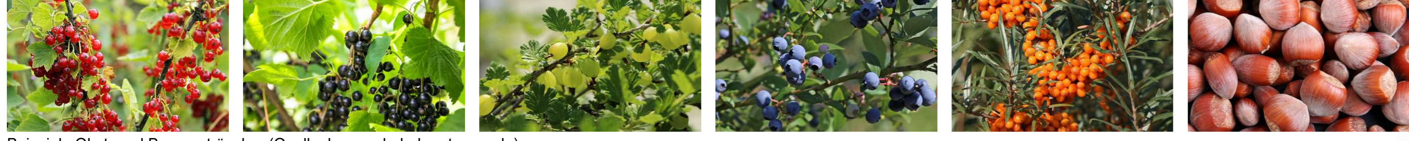
Beispiele Obst- und Beerensträucher