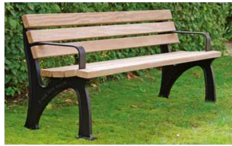
Beispiel Sitzbank mit Lehne