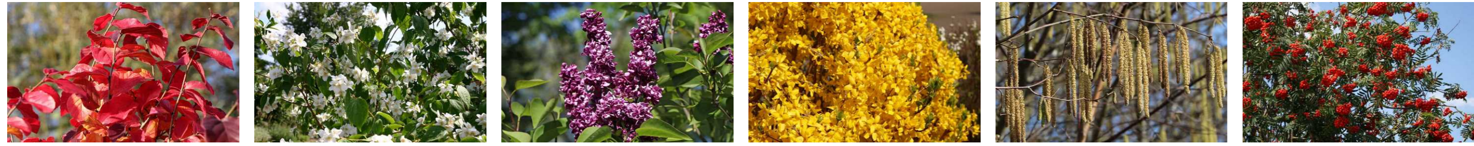
Beispiele Wild- und Blütensträucher