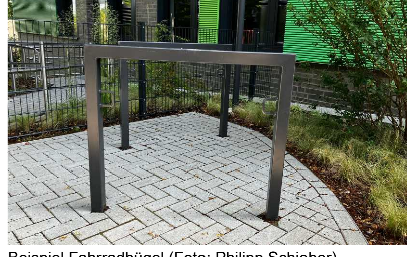
Beispiel Fahrradbügel