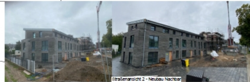
Straßenansicht 2 - Neubau Nachbar