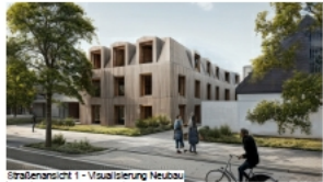
Straßenansicht 1 - Visualisierung Neubau